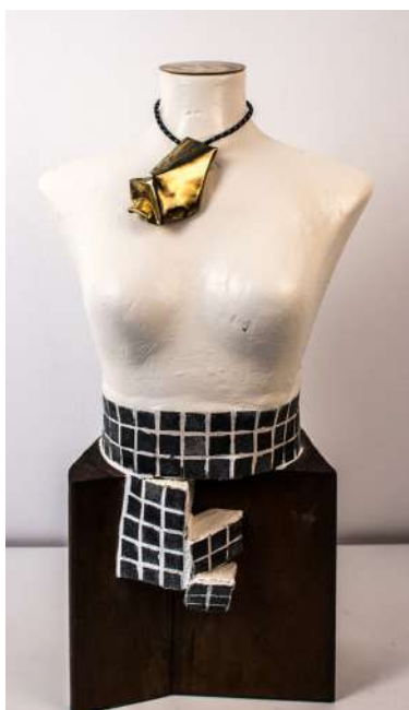
TORSO Félix Gala