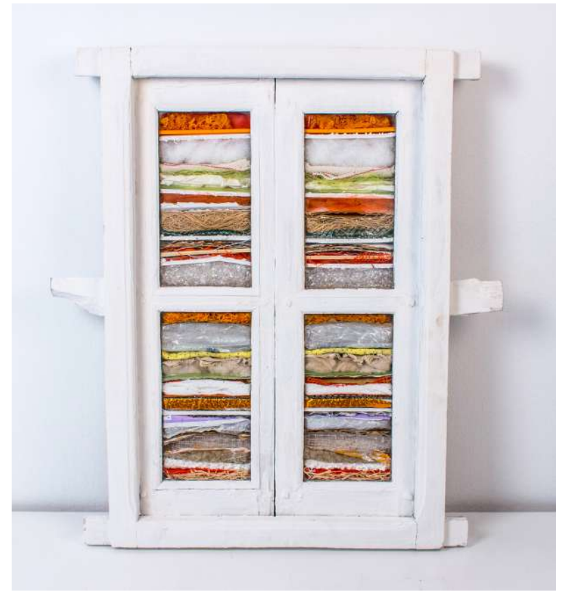
SEDIMENTOS (S.XXI) Matilde Navarro