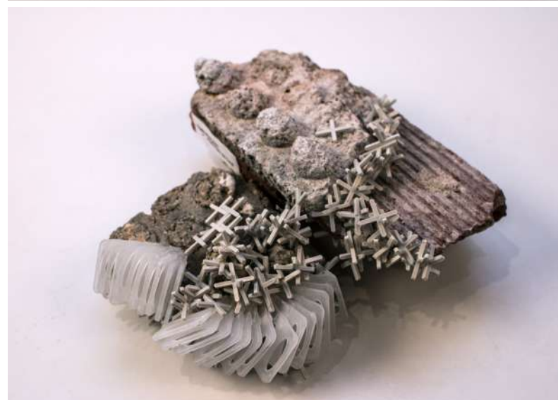
ABSTRACCIÓN DEL CORAL Consuelo León Peralta