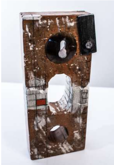
EDIFICIO 7 Carlos Servent