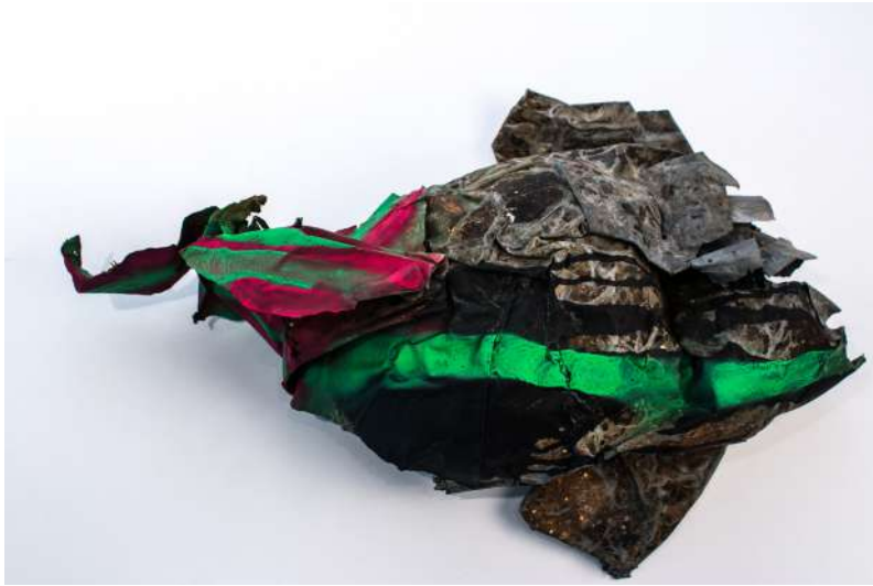
MÁSCARA DE TRIBU URBANA OCCIDENTAL, PUNKIS Mario Retuerta