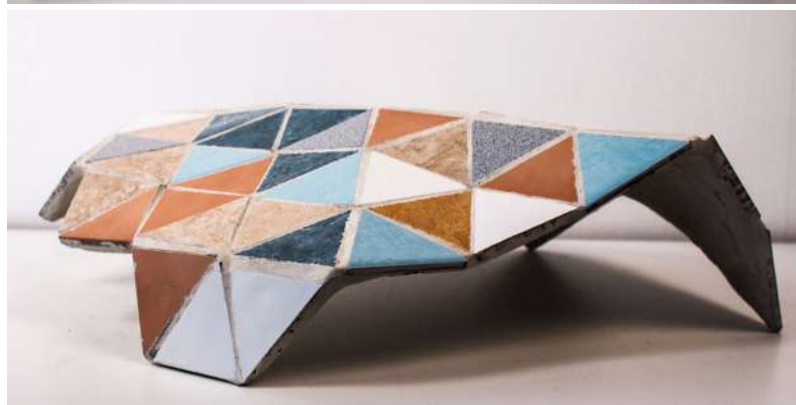
PIEL DE ESCOMBRO Isabel Fuentes García