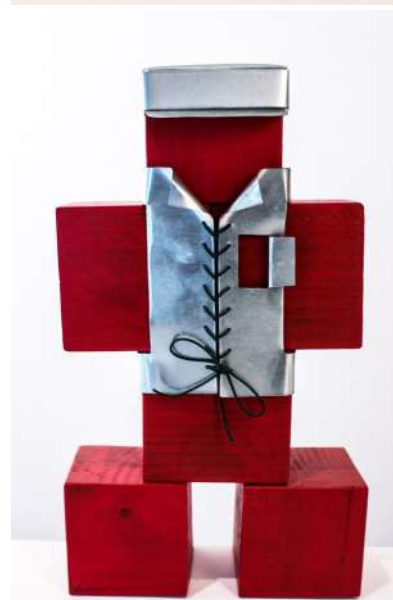
ACORAZADA María Fortes Blanco